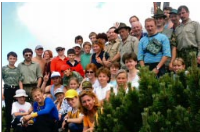
Pokr. zo str. 4

Cestou domov opäť lialo, ale nálada bola výborná. Spokojní, plní krásnych zážitkov, bez nehody sme sa večer vrátili domov.