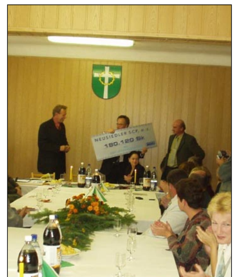
Slávnostné odovzdanie šeku prezidentom spoločnosti Neusiedler SCP v Zasadace KD v Liptovskej Štiavnici.