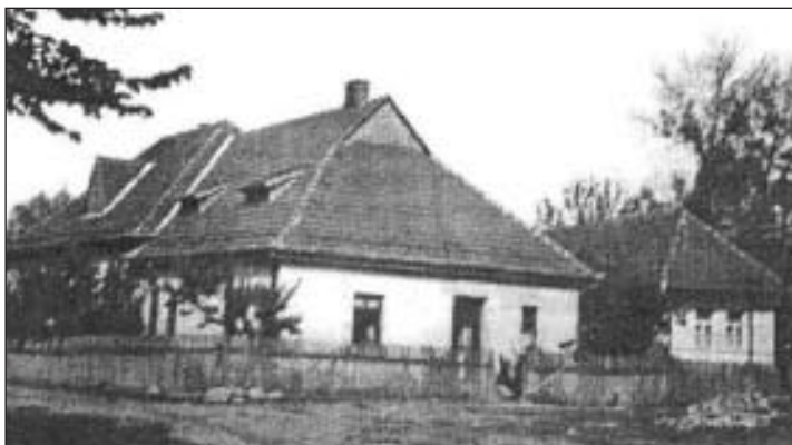
Vzhľad bývalej školy

Chuť bola veľká, no hruška ešte väčšia. Nebolo spôsobu, ako sa ku hruškám, či na hrušku dostať. Tak len stál pod hruškou, pri plôtiku, v nádeji, že sa stane zázrak a niektorej hruške sa uráči dolu na zem. Aby to trochu urýchlil, tak si len tak sám pre seba žobronil: „Duj vietor duj, odpadni mi hruška do môjho bruška...“ V tom zápale odriekania a čakania pod hruškou nevenoval pozornosť tomu, že za chrbtom sa k nemu prikráda náš pán správca. Potom samozrejme, keď vás ťahajú