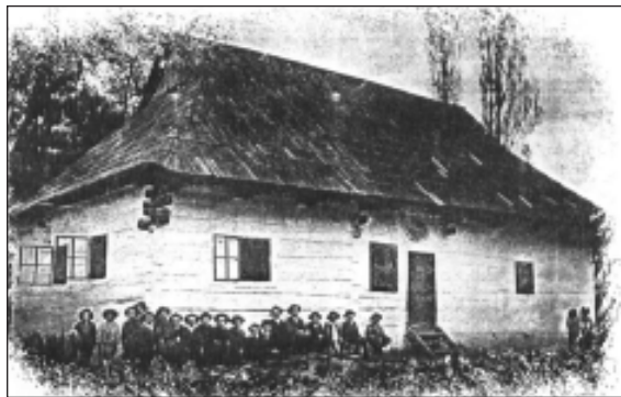
Budova starej školy

Keď som bol malý môj otec spomínal, že oni chodili do školy jednu-dve zimy ešte do starej školy, ktorá bola poblíž zvonice.