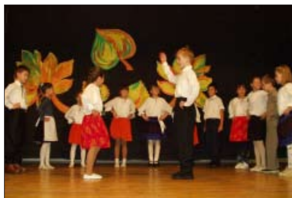
Z programu venovanému dôchodcom - 2004

Ďalšou tradičnou akciou školy býva karneval. Nebolo