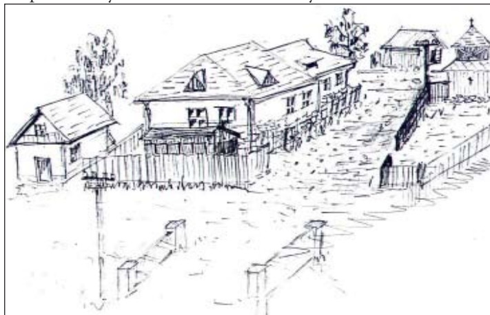
Vzhľad bývalej školy - kresba autora

a jemná pani, na ktorú si naša generácia s úctou spomína. Bývali v budove školy, presnejšie povedané byt pána správcu školy bol jej súčasťou. Okrem pána správcu a jeho manželky vystriedali sa za našich čias viacerí páni učiteľia a učiteľky. Títo bývali už len na súkromí v rodinách, kde boli na podnámom vytvorené aké-také skromné podmienky.