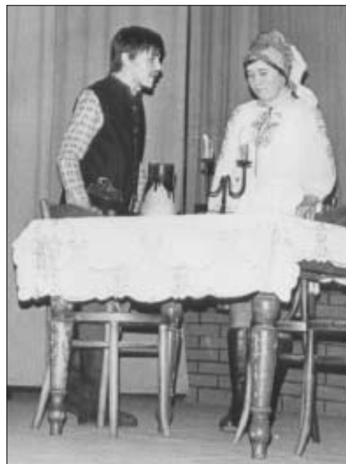
Z div. predstavenia „Huncút Klimko“ - 1975/76

sa žiakov mimo školy. Žiaci neslušne sa chovali oproti starším, oplzlé reči vraveli, vtáčiky vzduchovkami ostrelovali, psov týrali, nemali dobrého vzhladu, dlho do noci po dedine sa túlili....Pravdaže väčšina rodičov pochopila úsilie školy a došlo k nápadnému zlepšeniu v chovaní žiakov mimo školy.“