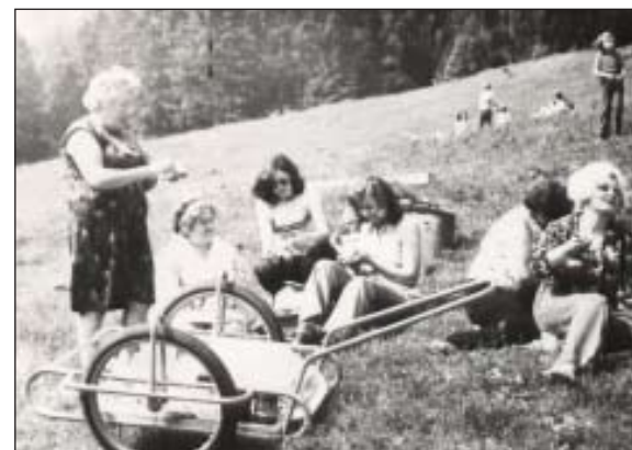
Výlet v Komorníckej doline - 1976

„V tomto školskom roku Združenie rodičov a priateľov školy veľmi obšírne a do hĺbky sa zaoberalo na svojich schôdkach cho-