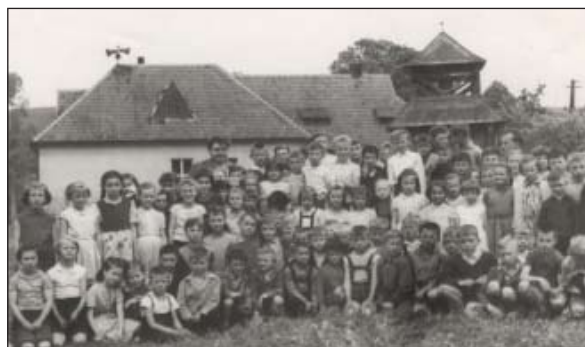
Žiaci školy - 1962

Od školského roku 1947/48 sú v kronike zaznamenané aj oslavy rôznych výročí a jubileí štátov a štátnikov, čo vo vtedajšej politickej situácii patrilo k povinnostiam škôl. Mnohí si určite spomínate na každoročné oslavy SNP, Sviatku práce, Dňa víťazstva, Pražského povstania, bohaté kultúrne programy sa pripravovali k výročiam Veľkej ok-