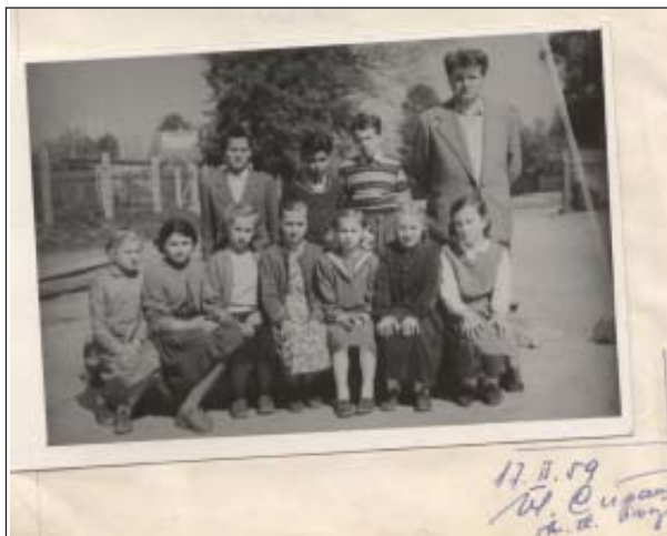
5.ročník odchádza do 6.triedy v OSŠ

čiatku organizované so zámerom získať finančný príspevok pre školu. Medzi najtradič-