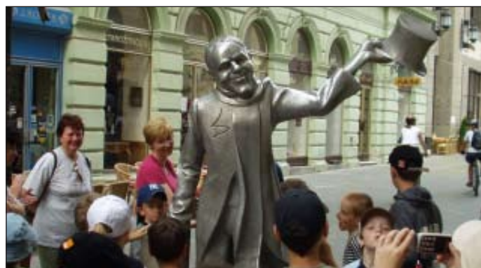
Zo školského výletu v Bratislave - 2004