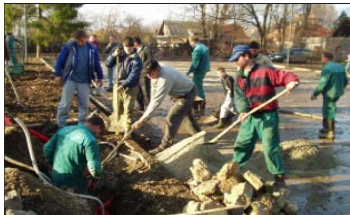
... musia občas priložiť ruku k dielu aj rodičia.

jazykové a počítačové krúžky. V popoludňajších hodinách im je k dispozícii ŠKD, v kuchyni sa pre nich denne pripravuje chutná strava. Svoju šikovnosť a talent môžu prezentovať na pravidelných vystúpeniach pre občanov Štiavnice a zapájaním sa do rôznych súťaží. Našou snahou je zabezpečiť našim zákazníkovi – žiakovi plný servis čo sa týka vybavenia školy ale