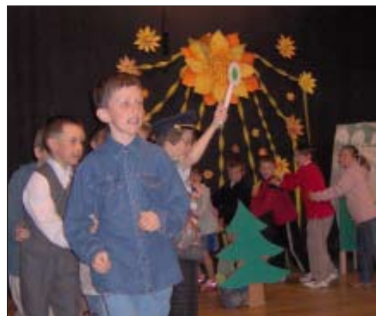
Z programu ku Dňu matiek - 2005

Deti sa vždy veľmi tešia aj na prípravu programu pre mamičky. Zhotovujú pre ne Hneď na jeseň začíname nácvikom programu pre starších spoluobčanov. Rôzne scénky, tančeky, básničky vždy potešia deduškov a babičky. Detský prejav a bezprostrednosť je vítaným spostením programu, ktorý už niekoľko desaťročí pripravuje obecný úrad