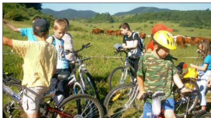
Cyklistické preteky - 2005

Určite mi teda dáte za pravdu, že v našej škole máme šikovné deti. Nesedíme kdesi v kúte, ale svojou aktivitou a prácou predstihneme častokrát aj „veľké“ školy.