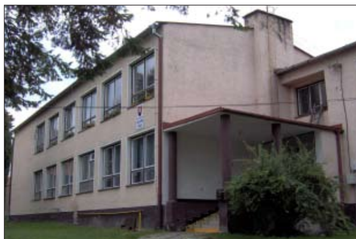
Súčasná budova školy