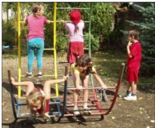
Aby sa pri škole mali kde deti hrať...

Priam utopistická myšlienka je rozrásť sa na plne organizovanú školu, ale jej utópia závisí len od toho, ako ďaleko