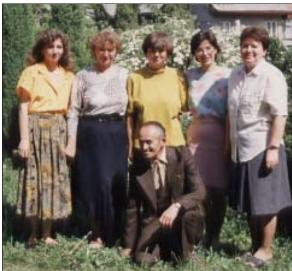
Učiteľský zbor v šk. roku 1991-92