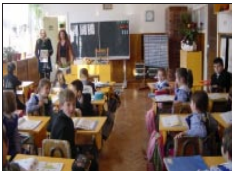
Priatelja z Rumunska

medzi zúčastnenými prebieha v angličtine, takže žiaci sa zdokonaľujú aj v tomto smere. Prvou úlohou bolo od prezentovať svoju obec a školu, v druhej pripravili žiaci vlastné