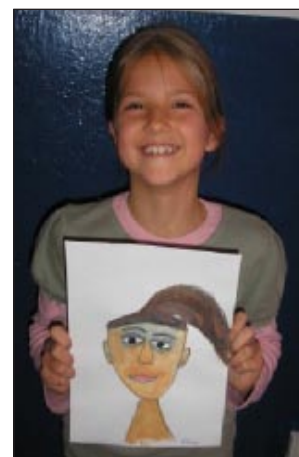
Tu sú niektoré z našich šťastných detí