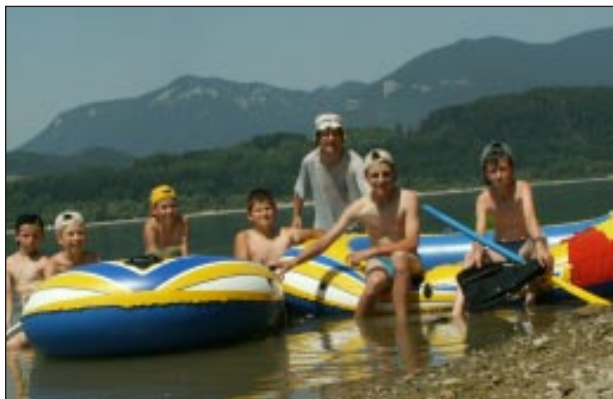
Naši miništranti - trocha netradične - člnkovanie na Liptovskej Mare počas letných prázdnin