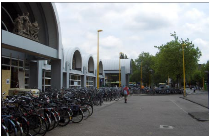
Bicykle pred železničnou stanicou v meste Delft

No a tam som si spomenul na moje chlapčenské bicyklovanie v inom teréne a za iných podmienok, doma, v mojej rodnej Liptovskej Štiavnici. ■