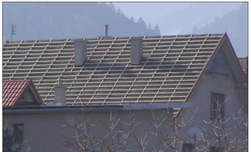
Dcý]Ygh]W'h X cVW''''''

opravu po kodenej krovu. Fotokópia faktúr bude uložená na obecnom úrade s možnosťou nahliadnutia.