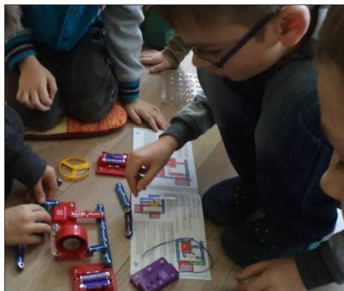
: chc'n'UFVW#i 'y_c'm

Vhodný výber krúžkov závisí tiež od ich konkrétneho zame-