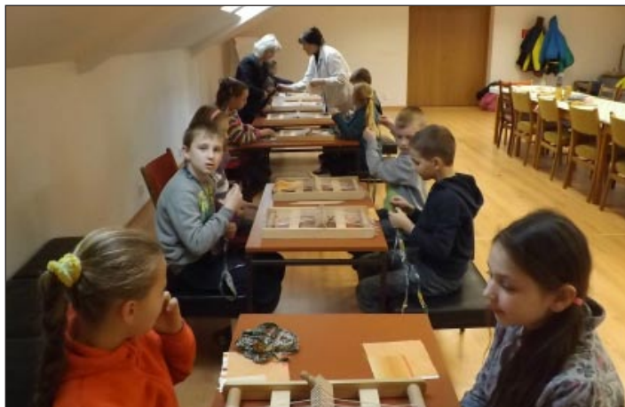
: chc'n'UFVW#i 'y_c'm

ce bije? Prečo vietor fúka a kde je, keď nefúka? Prečo človek snívá? a ďalšie iné. Spoločne zisťujeme ako sa vyrábajú veci dennej potreby, lúštíme hlavolamy a hádanky, hráme sa spoločenské hry, chodíme na tvorivé dielne do mesta a stávame sa remeselníkmi, spoznáваме prírodu v okolí obce, robíme malé pokusy a sledujeme všetko malé pod mikroskopom, zjazdeme i k počítačom, kde vyhľadávame a spracovávame následné informácie. Tento školský rok nás je devätnásť a sme super partia od prvákov po tretiaikov. Veľa sme už toho zažili a veľa nás ešte čaká. My síce nešermujeme a nemáme ani hrnčiarcky kruh, ale je nám spolu fajn. ■