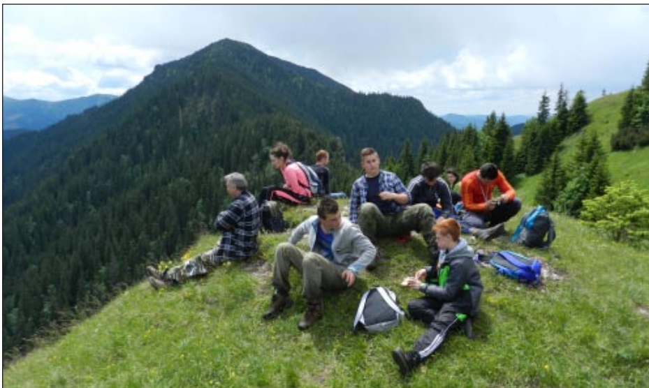
DcX`GU`Uh#bca`!`dfYgrzj`_U`bU` : f]`cj` W`g`U`zW`