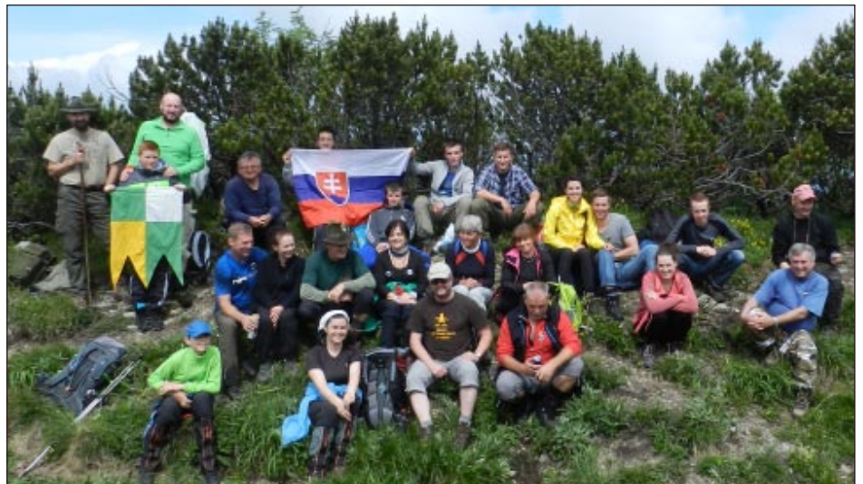
HUXJ bz j fWc`cj`U`

Hoci to ráno vyzeralo sľachom, po asími naozaj