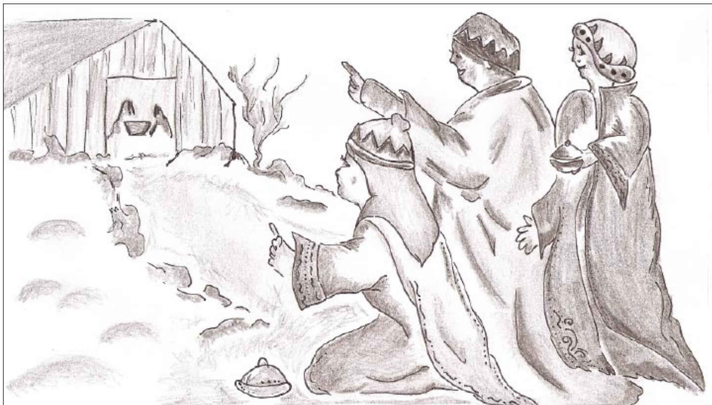
Kresba: Oľga Prekopová