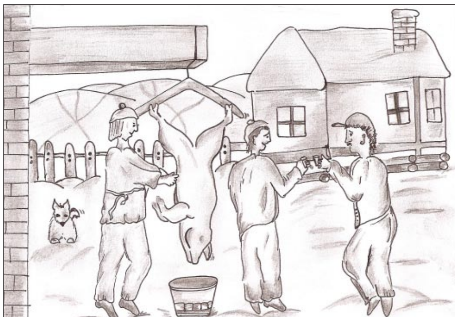
Na tradičnej „zakálačke“...

Zaniklo tiež tkanie plátna, ktoré sa robilo na krosnách. Krosná boli zhotovené z dvoch drevených rámov spojených priečnymi brvnami. Na jednom konci krosien bol valec s niťami osnovy, ktoré sa z neho viedli cez nitelnice a brdo na druhý koniec krosien kde sa na valec natáčalo utkané plátno. Brdom, ktoré vďaka zaveseniu v hornej časti krosien sa mohlo pohybovať dopredu a dozadu, tkáčka ubíjala priečnu niť. Priečnu niť, útok, presúvala cez osnovu tkáčka, pomocou dreveného čluka, v ktorom bolo uložené kľbko útkových nití. Pamätám na tkanie handro-