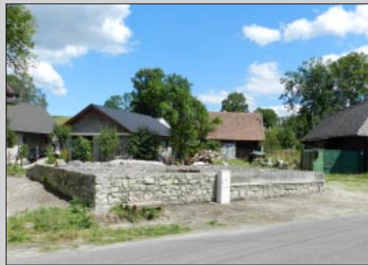
Príprava na nové riešenie stavby

Vďaka každému, ktorý sa akýmkoľvek príspevkom pričínil o pomoc.