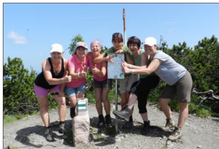
Na vrchole Salatína