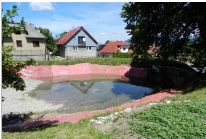
FrnVbĹ j c ZrnY bUd• y UbJU