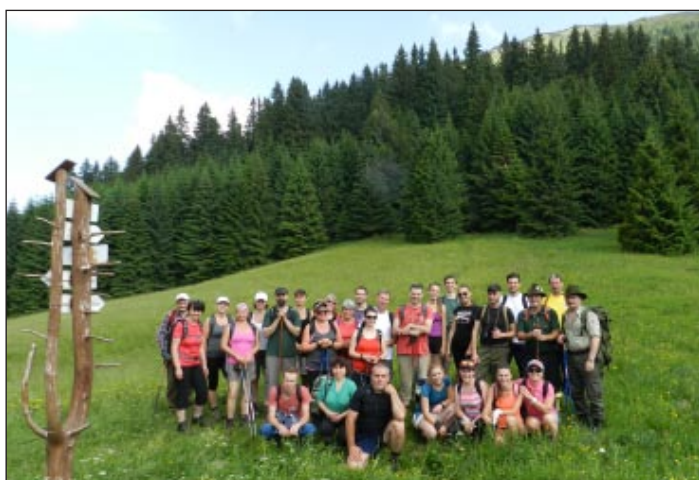
Pred strmým výstupom na vrchol...

účastníci, ktorí sa zúčastnili výstupu za ostatné tri roky poznali - začiatok po klasickom „zelenom“ chodníku, pokračovanie cez tzv. Komín. Kto pozná vie, kto nepoznal už vie tiež. Žiadne značky, ale spoliehať sa na chlapov