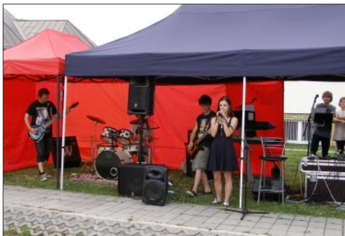
Vystúpenie hudobnej skupiny