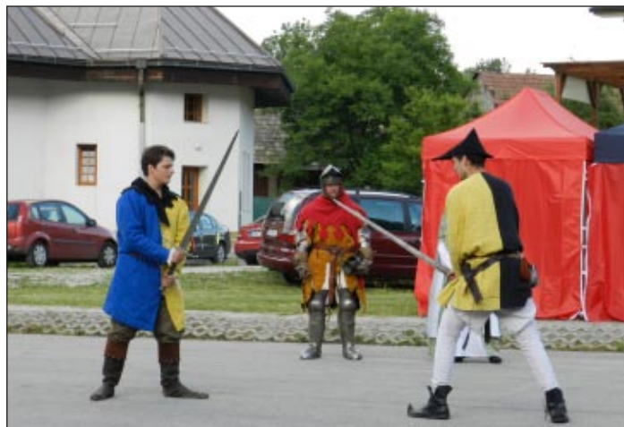
Vystúpenie historických šermiarov