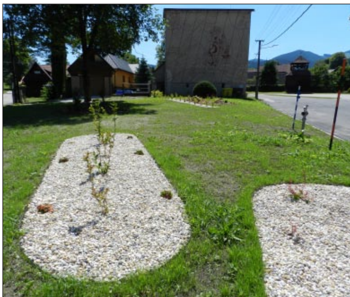
Nový park pred Kultúrnym domom