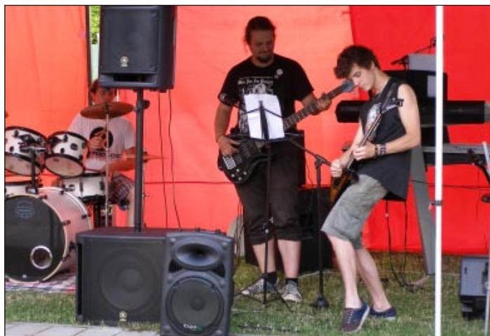
Vystúpenie hudobnej skupiny