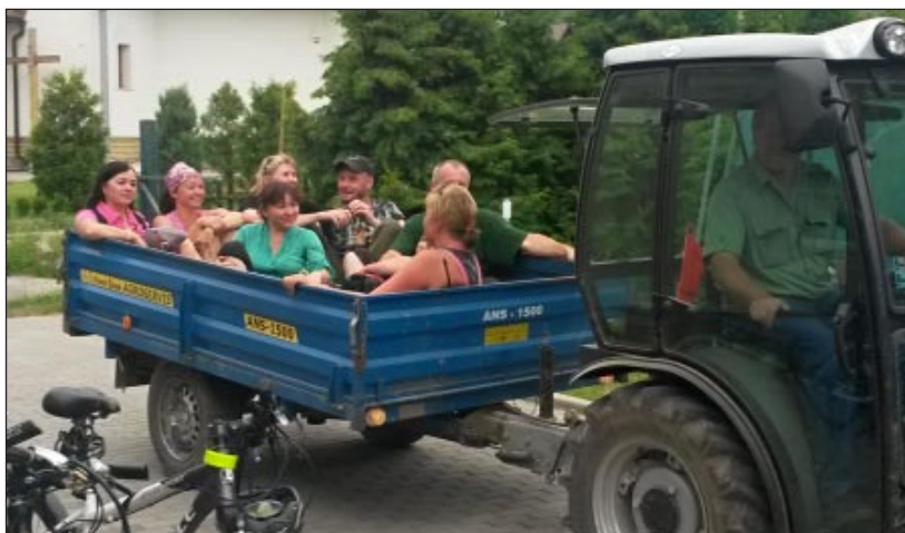
Poslední navrátilci domov