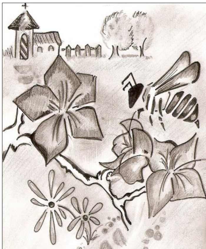
Príroda už oživa...