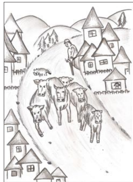
Vyháňanie jalovic na pašu

Úzke pásiky rolí boli ohraničené po dĺžke na oboch stranách medzami, na koncoch ktorých boli hřby každoročne z prilahlej role vyzbieraných kameňov. Medze slúžili aj protierozne a ako úkryty menších divých zvierat (od vtáčať po zajace). Na jar sa sial jačmeň a ovos a koncom leta, začiatkom jesene oziminy (žito, ozimný jačmeň). Sialo sa ručne. Tým začínal proces, ktorý pokračoval žat-