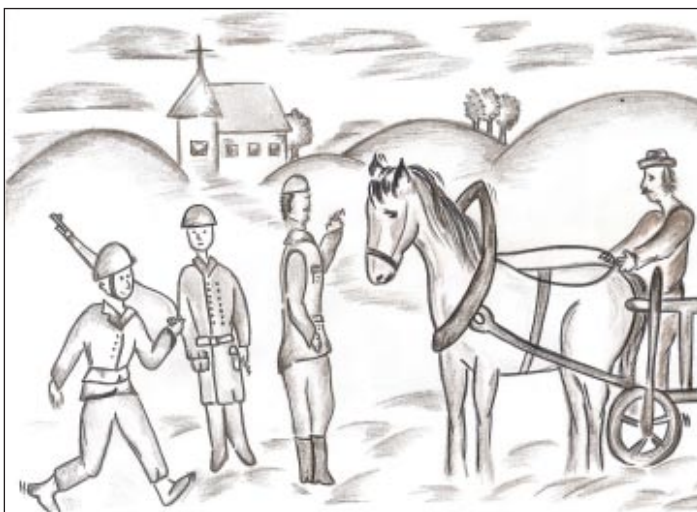
Medzi nemcami a gardistami...

ky bol úzkoprofilový tovar. Topánky, boli len kožené (plasty ešte neboli), bežne sa podbíjali práve takými podrážkami. Náš voz bol došteniak (ostatné boli rebriniaky) a zrejme