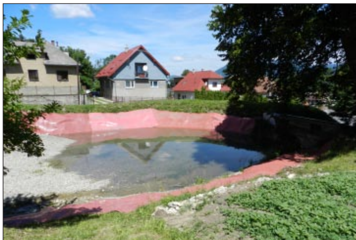
Rybník vo fáze napúšťania