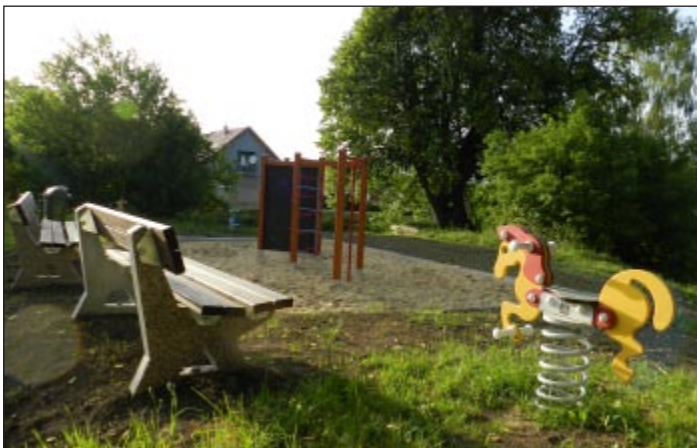
Detský park aj s lavičkami pre rodičov

Do 15. storočia bol každý jednotliviec, aj v našej obci, pomenovaný len krstným menom (podľa zoznamu v kresťanskom kalendári). V dôsledku zvyšovania počtu obyvateľstva sa stále častejšie vyskytovali občania s rovnakým krstným menom. Preto sa pre ich rozlíšenie začali používať prídavné, prezývkové mená, takzvané prímená. Spočiatku sa tak robilo len u šľachticov a hodnostárov a až v 16. storočí aj u poddaných. No i tak až do 17. storočia, bolo krstné meno pre jednotlivca stále hlavnou časťou osobného mena. Prídavné, prezývkové mená v 16. a 17. storočí neboli dedičné a ich používanie nebolo záväzné, mohli sa meniť. Niektoré prímená boli trvalými prezývkami pre rodinu a označovali sa nimi aj potomkovia a neskôr sa z nich, stali priezviská. Popud pre vznik priezviska dal v roku 1614 pápež Pavol V. pokynmi, podľa ktorých sa v každom kostole malo viesť päť druhov farských kníh: kniha pokrstených, birmovaných, sobášených, zomrelých a kniha o stave veriacich. Používanie mien z dvoch častí, krstného mena a z prímená, nariadil počínajúc rokom 1780 Jozef II. Vzniklo tak priezvisko. Postupom času však ďalej rástol počet obyvateľov a nielen krstné mená ale aj