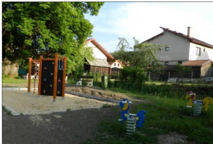
Detský park - hojdačky a preliezka

parcely však zostali nevysporiadané a na dvoch pozemkoch je vecné bremeno. Ináč je celá miestna komunikácia vo vlastníctve obce.