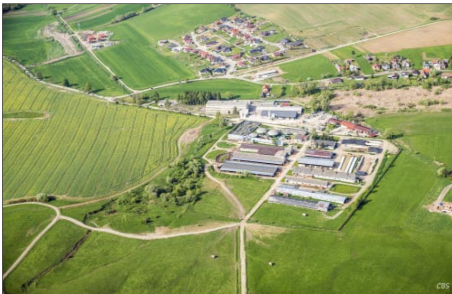
Priestory poľnohospodárskeho družstva

Skutočnosť je takáto: všetky vyspelé krajiny sveta dotujú poľnohospodársku výrobu preto, lebo v týchto krajinách a aj na Slovensku viac ako 50 % občanov má voči uvádzanému priemeru značne nižšie mzdy a dôchodky. Ak by ceny potravín v týchto krajinách vychádzali zo skutočnej výrobných nákladov na poľnohospodárske výrobky, museli by byť ceny potravín podstatne vyššie ako sú v súčasnosti. Tieto nízke príjmové skupiny našich obyvateľov by nemali dostatok financií na nákup potravín a práve dotačnou politikou sú základné potraviny dostupnejšie aj pre túto časť obyvateľov jednotlivých štátov. ■