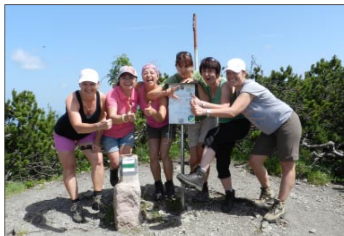
Na vrchole Salatína

účastníci, ktorí sa zúčastnili výstupu za ostatné tri roky poznali - začiatok po klasickom „zelenom“ chodníku, pokračovanie cez tzv. Komín. Kto pozná vie, kto nepoznal už vie tiež. Žiadne značky, ale spoliehať sa na chlapov