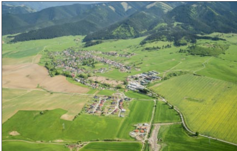
Letecký pohľad na obec

Vážení štiavničania, myslím, že väčšina z Vás vie, kto obhospodaruje polia našich chotárov – Liptovskej Štiavnice, Ludrovej a Štiavničky – sú to naši družstevníci z Poľnohospodárskeho družstva Ludrová.