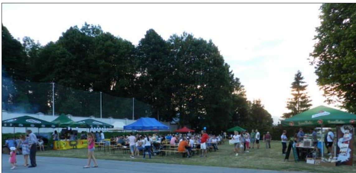
Účast' občanov bola bohatá