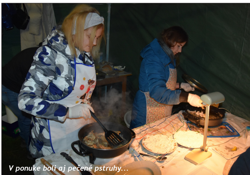
V ponuke boli aj pečené pstruhy...

Touto cestou, by sme sa chceli poďakovať všetkým organizátorom, obecnému úradu, základnej škole, predajcom, účinkujúcim, sponzorom, ale hlavne vám milí občania, ktorí ste sa trhov zúčastnili v takom hojnom počte.