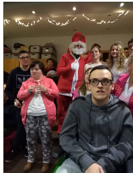
Mikulášske posedenie - Ružičky

Tak takéto boli Vianoce môjho detstva a ja na ne spomínam s nostalgiou, lebo boli skromné, bez okázalých darčiekov, ale v mojej duši navždy ostávajú ako tie najkrajšie spomienky na moje detstvo.