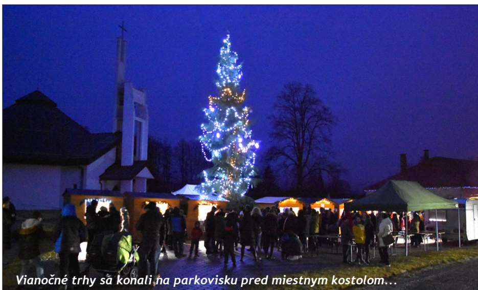
Vianočné trhy sa konali na parkovisku pred miestnym kostolom...