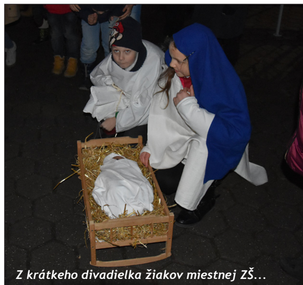
Z krátkého divadielka žiakov miestnej ZŠ...