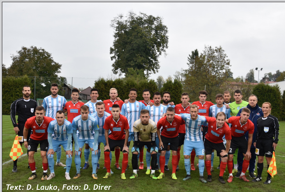
Text: D. Lauko

Už od rána 9.10.2019 žila obec v očakávaní veľkého športového sviatku. Proti domácemu mužstvu TJ Družstevník Liptovská Štiavnica bol v 2. kole Slovenského pohára vylosovaný slávny futbalový klub ŠK Slovan Bratislava. Počasie nám síce neprialo, ale aj napriek tomu bolo o 15-tej hodine všetko pripravené k odohraniu zápasu. Konečný výsledok stretnutia bol 0:4 v prospech klubu Slovan, ale aj napriek tomu diváci, ktorí sa stretnutia zúčastnili, odchádzali domov s dobrým pocitom po peknom výkone aj našich domácich futbalistov. Prostredníctvom kamier a mikrofónov sa o tomto stretnutí dozvedela široká verejnosť nielen v regióne, ale aj na celom Slovensku. Ďakujeme hosťujúcemu mužstvu za korektný výkon a slušné športové správanie. Zápasu sa zúčastnilo takmer 500 divákov z blízkeho i ďalekého okolia. Poďakovanie patrí všetkým organizátorom za hladký priebeh futbalového zápasu.