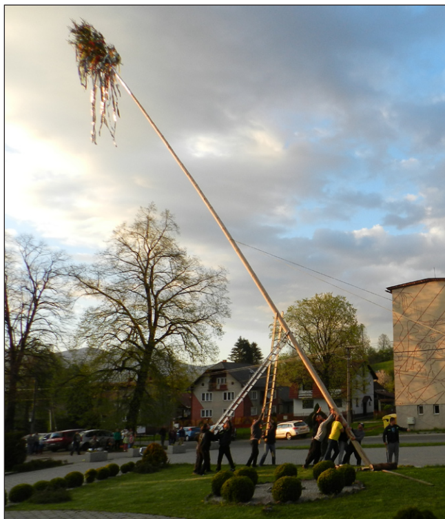
Spomienka - stavanie mája v roku 2016

Tohtoročný Deň obce je predo dvermi a ja som rád, že aj dnes sa majú možnosť stretnúť všetky generácie obyvateľov našej obce, užiť si program našich malých následníkov, ochutnať klobásky, placky a podobne, pri pivku vymeniť názory a poklebetiť. Teší ma ale aj to, že niet detí, ktoré by s prázdnyimi vreckami smutno hľadeli na stánky plne dobrôt, ale že si celé rodiny môžu bezstarostne vychutnať zábavu a tanec pod holým nebom. ■