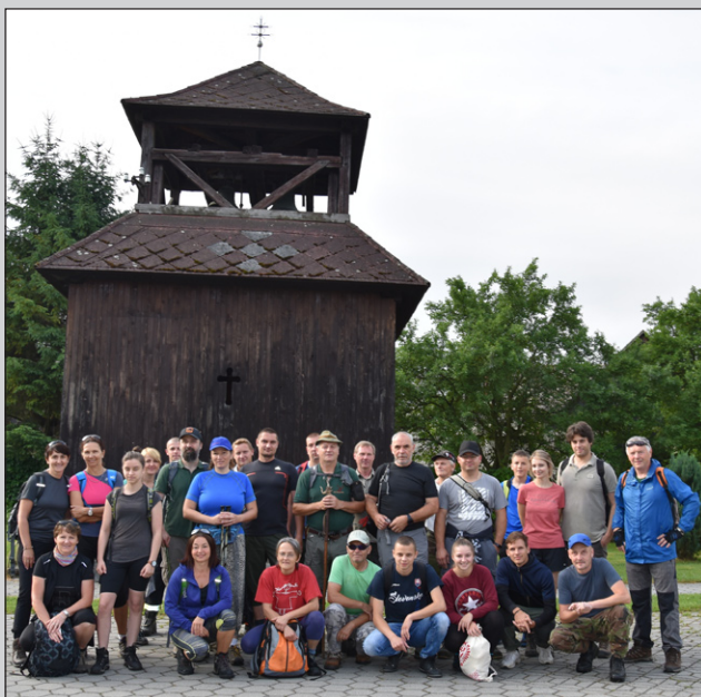
Ráno pred odchodom

Fotogalériu akcie nájdete na https://lnk.sk/hlm7