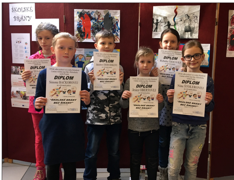
Fotografie z archívu školy