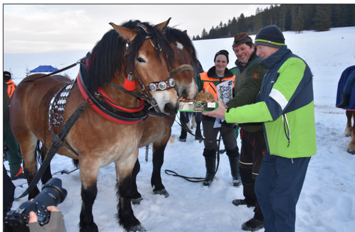
Torta pre víťazov