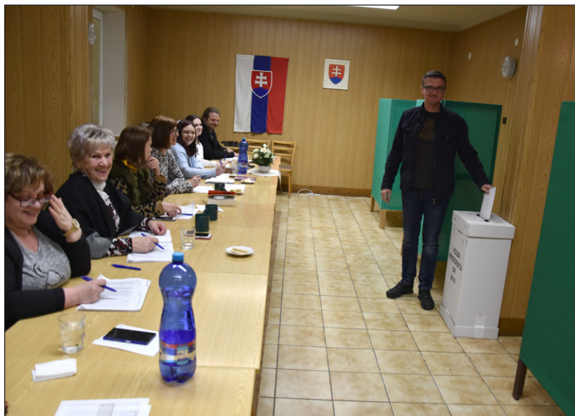
Voľby sa konali v Malej zasadačke Kultúrneho domu