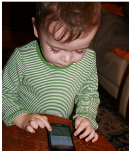
Zručnosť malých detí je viditeľná...

riadeniach. Nielen mládež si život bez mobilov, i-padov, notebookov nevie predstaviť. Aj my starší ich v rozsiahlej miere používame. Stačí pár klikov a dozvieme sa novinky, fakty,