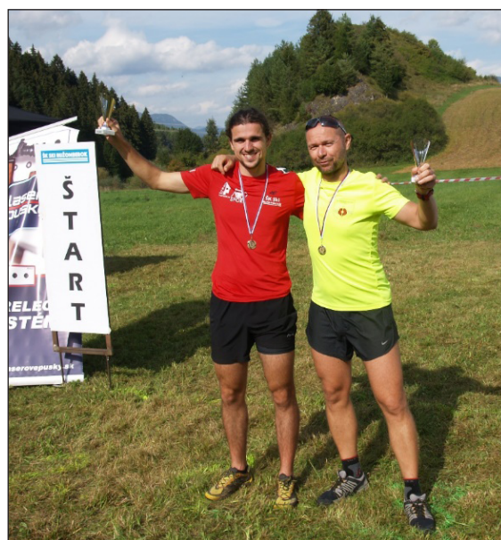
Absolútni víťazi v pretekoch dvojíc

Počas zimnej sezóny 2020/2021, ak to snehové podmienky dovoľia budú zanietenci z ŠK SKI Ružomberok pripravovať trate pre bežecké lyžovanie pod lúčnym hríbom. Všetci ktorí majú záujem sa dozvedieť viac