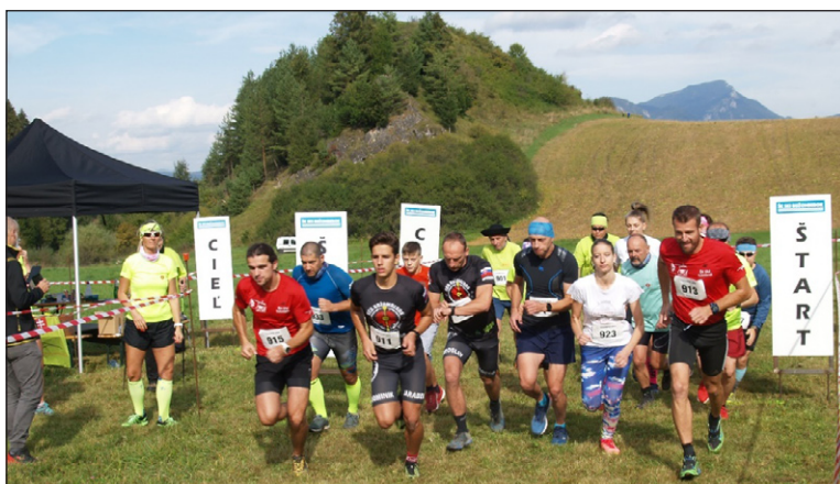
Pretekári na štarte v kategóriách dvojíc na 4,6km

odovzdávka. Pre deti a mládež, ktoré pretekali v kategóriách jednotlivcov boli pripravené trate o dĺžke 300m, 600m a 1000m. Počas behu boli na súťažiacich pripravené aj prekážky, ktoré bolo potrebné preskočiť, podliezť, obísť a to všetko v pretekárskom tempe. Na pripravenej strelnici si mohol každý vyskúšať presnosť svojej mušky pri strelbe v polohe ležmo z laserových pušiek. Zo streleckého stano-