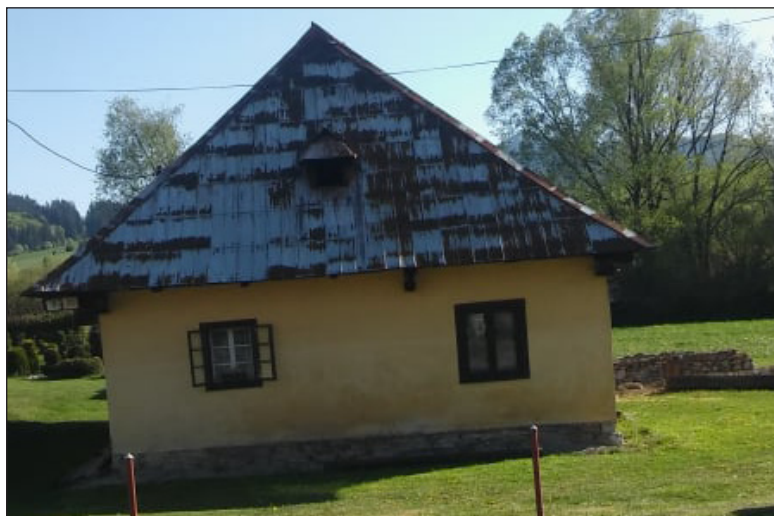
Pred časom nenápadná chalúpka na začiatku obce