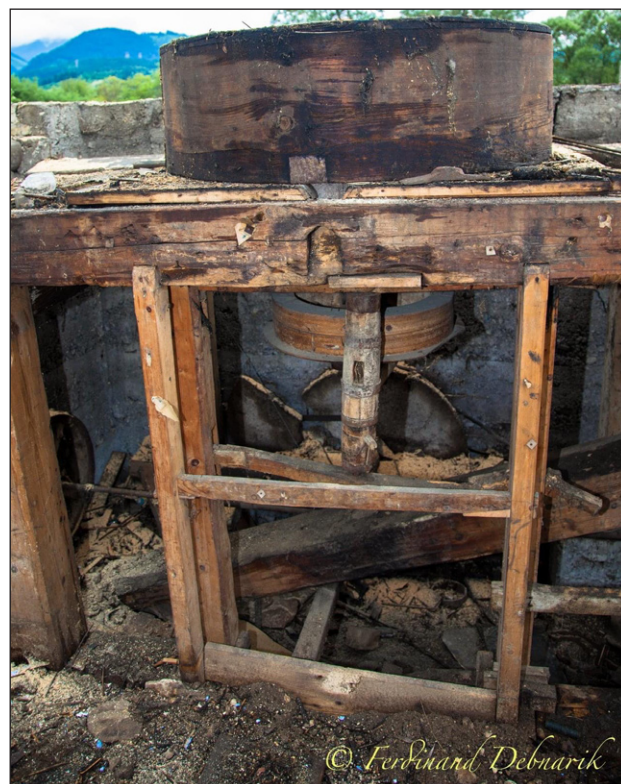
Časť mechanizmu starého mlyna