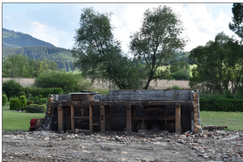
V súčasnosti zostalo z budovy iba torzo...