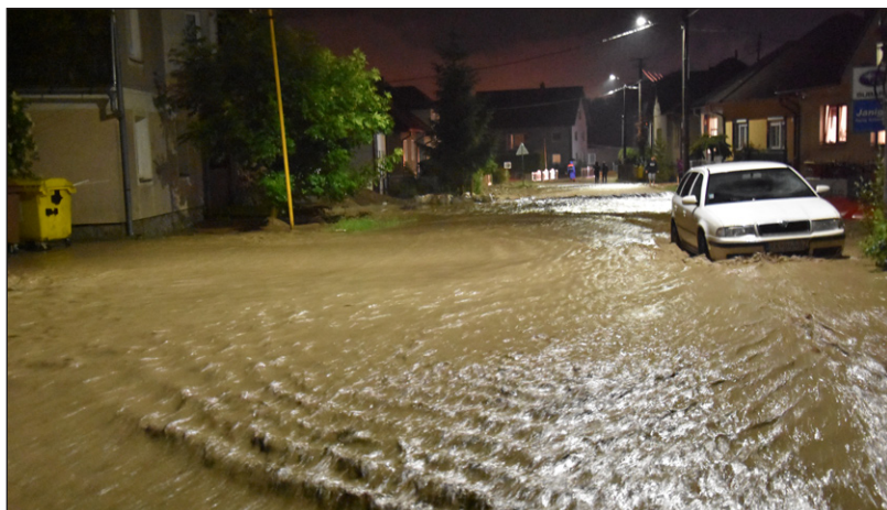
Cesta sa stala korytom potoka...

Ráno nás privítalo slnečnou oblohou a letná sobota sa, namiesto spomínanej turistickej akcie, niesla v duchu brigádnickej čin-