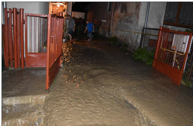
Voda tiekla aj dole dvormi

v ceste. C h c e m pochváliť miestnych hasičov, ktorí neváhali ani minútu a po zaznení sirény začali zachraňovať, čo sa ešte z a c h r á n iť dalo. Pracovali t a k m e r