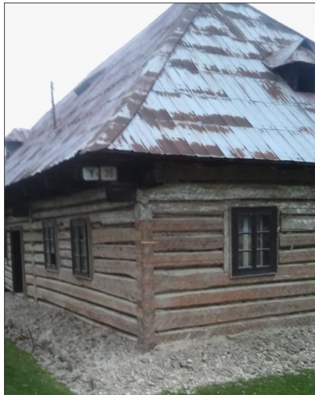
Pred asanáciou budovy