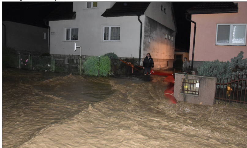
Z rozvodneného potoka sa voda valila priamo do dvorov

škôd po povodni. Ďalej chcem pochváliť aj pracovníčky obecného úradu, ktoré zvládali plniť administratívne úlohy jednak pri zasadnutí krízového štábu a jednak pri zadmiňovaní celej povodňovej udalosti. Na záver poďakovanie patrí všetkým, čiže celej obci. Jedni pomáhali, jedni boli nešťastní zo spôsobených škôd, ale aj napriek tomu sme dosiahli to, že obec bola spolu patričná a držala spolu. Ďakujem.