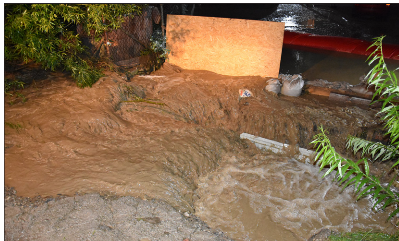
„Hľadať si cestu“ vode sem-tam bránili prekážky...

Poznámka: Dňa 2. 7. 2020 sa uskutočnilo rokovanie Obecného zastupiteľstva, kde poslanci OZ odsúhlasili vytvorenie transparentného účtu č.: SK71 0900 0000 0051 7161 4253 (Variabilný symbol 200626) na dobrovoľnú zbierku slúžiacu na pomoc postihnutým občanom. Za všetky finančné prostriedky vopred ďakujeme. ■